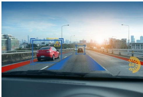
Automotive Data & Time-Triggered Framework

Telefon: +49 (0)941 4662 4310 Mail: info@digitalwerk.net