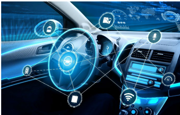
Bild 2: ADTF ist das umfassende Software-Framework für die Entwicklung und Prüfung von ADAS-Funktionen bis hin zu autonomen Systemen.