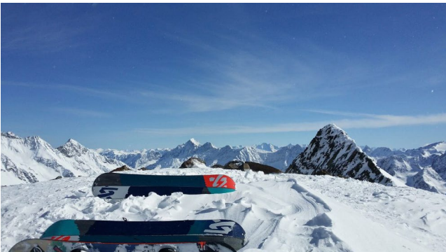
Bild 3 Die Mitarbeitererevents wie beispielsweise die gemeinsamen Skifahrten sind fester Bestandteil der digitalwerk Unternehmenskultur.