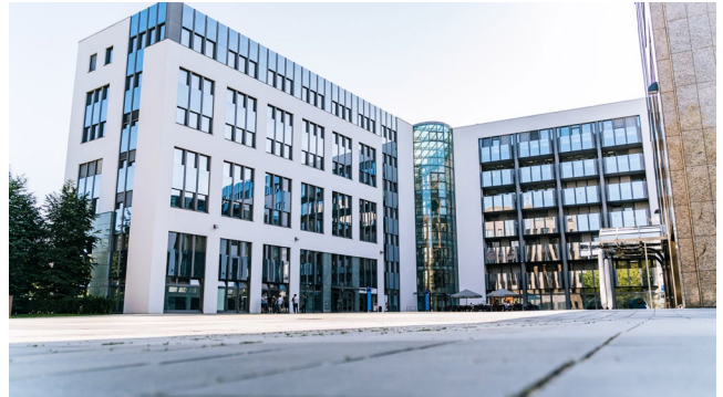
Bild 2 Die Büroräume im Regensburger Gewerbepark.