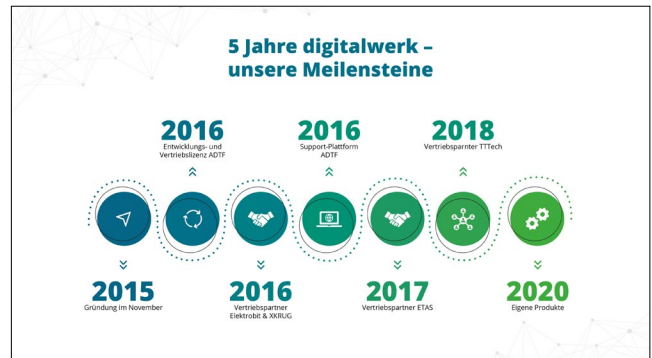
Bild 4 digitalwerk blickt auf fünf erfolgreiche Firmenjahre zurück.